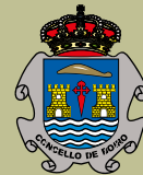
Concello de Boiro