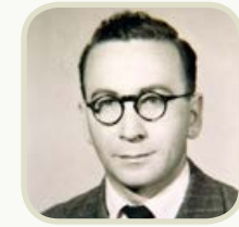
Xosé María Díaz Castro

Nacido o 19 de febreiro de 1914 no concello de Guitiriz, Lugo. Estudou no Seminario de Mondoñedo, onde confirma a súa vocación de escritor e época na que escribiu Follas verdes e Follas ao vento . En 1931 publica o primeiro poema en lingua galega no xornal El Progreso Villalbés . Participa na guerra civil e en 1939 abandona definitivamente o seminario. Apoiado por Iglesia Alvaríño comezou a traballar no Colexio León XIII de Vilagarcía de Arousa. En 1946 gaña os Xogos Florais de Betanzos coa obra Nascida dun soño , tríptico de sonetos. En 1948 establécese en Madrid, cidade na que traballa como tradutor do Ministerio do Interior, logo do Instituto de Estudos Hispánicos e ao final no C.S.I.C. Ademais realizou importantes traducións para editoriais como Aguilar, poñendo en castelán autores como Chesterton, Yeats, Rilke e Pontoppidan. Colaborou en La Noche e Alba e unha selección da súa poesía aparece en Escolma da poesía galega de Fernández del Riego en 1955. En 1961 a editorial Galaxia publica o seu poemario Nimbos , unha busca da trascendencia e de resposta a problemas fundamentais da condición humana, con forte pegada telúrica, pero tendo en conta a Galicia real e histórica. A presenza da luz é clave na súa obra. Poesía profunda, pero austera, de ritmo lento e grande veracidade. Falece en Lugo o 6 de outubro de 1990.